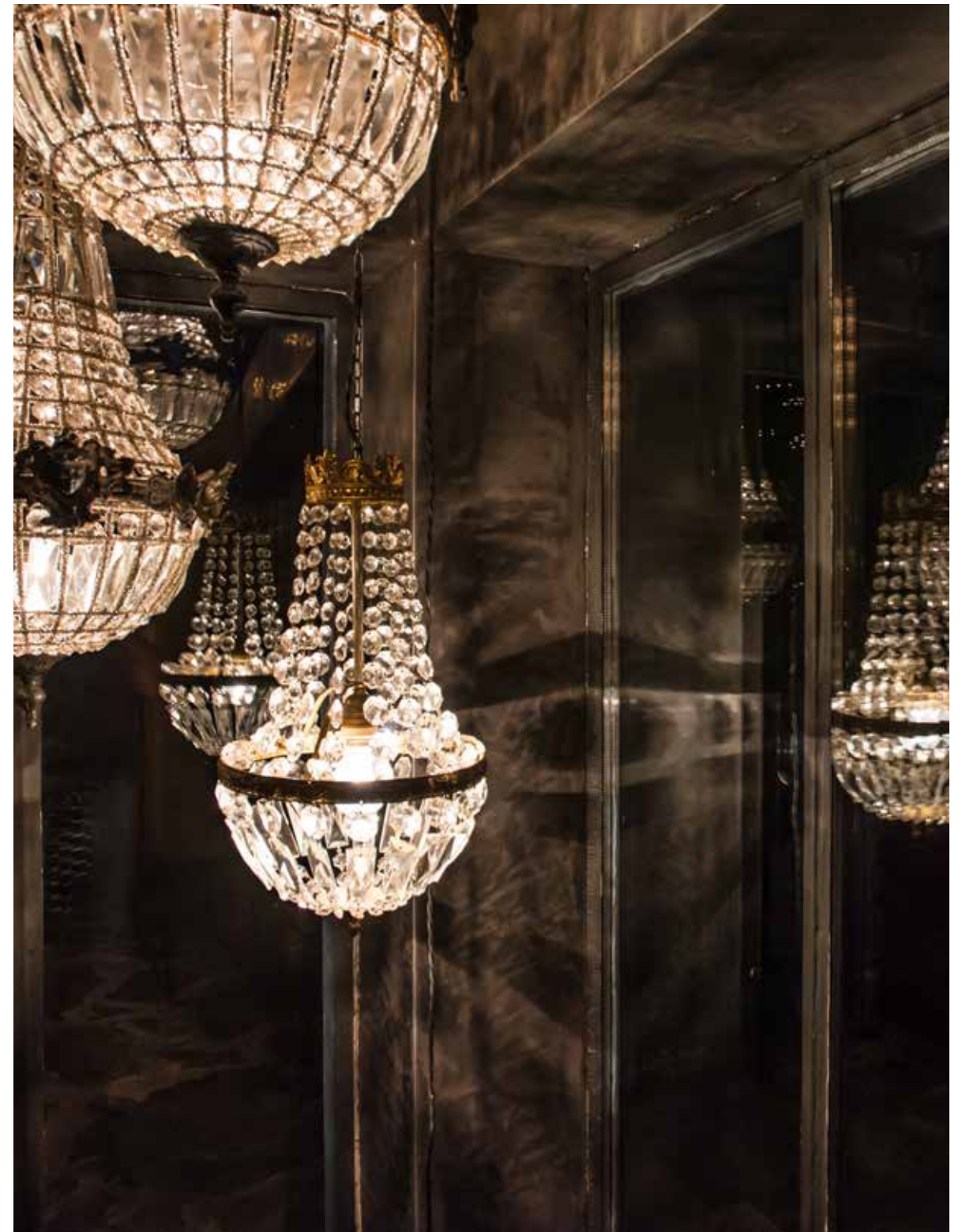
Alleen de veranda is een nieuwe uitbreiding van het huis en smelt ontzettend mooi samen met de authenticiteit van de woonruimte. De verschillende accessoires en kroonluchters heeft Ines in een brocantewinkel op de kop kunnen tikken. De lange tafel hebben Ines en haar man dan weer zelf ontworpen. Het stalen onderstel werd gemaakt door een bevriend lasser en het blad bestaat uit gerecupereerd eikenhout afkomstig van oude treinwagons.